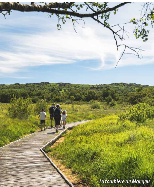
La tourbière du Mougau

In Commana, the Mougau peat bog at the foot of the Arrée Mountains is constantly saturated with water, and is at once fragile and vital to water supply. It is also a refuge for the marsh fritillary butterfly and viviparous lizard, with sphagnum among the flora that thrive here and play a key role in natural water regulation. Nearby, the gallery grave of Mougau-Bihan with its Neolithic engravings offers physical traces of prehistoric funeral rites. Further north, where the villages of Trémaouézan, Ploudaniel and Plouédern meet, Langazel peat bog was formed 11,500 years ago and is home to a mosaic of remarkable habitats. This is the source of the Aber Wrac'h stream, which supplies drinking water to 36 different villages, and the site illustrates the ecological, hydrological and heritage importance of Finistère's wetlands.