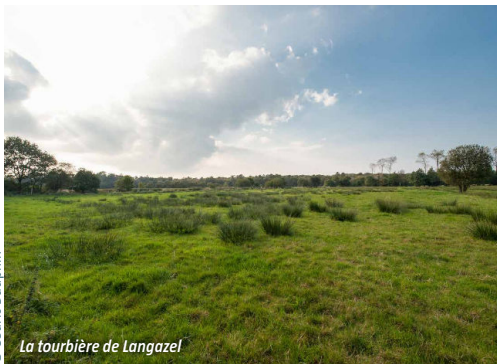
La tourbière de Langazel