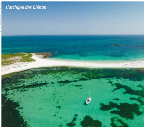
L'archipel des Glénan