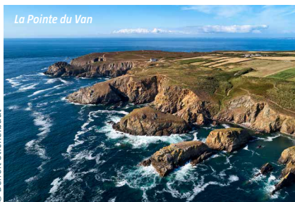
La Pointe du Van

Among the huge variety of landscapes in Finistère, 130 are owned by the council, representing nearly 13,000 acres of protected nature. This exceptional heritage is a refuge for rare flora and fauna, and is the subject of constant attention and preservation policies. For more than 50 years, the council has been ambitiously committed to protecting these environments through land acquisitions, sustainable habitat management, ecological restoration, regulated use and public-awareness campaigns. These actions encompass heritage enhancement and active biodiversity protection, ensuring that these natural spaces continue to inspire and amaze future generations.