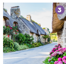
LES VILLAGES DE CHAUMIÈRES