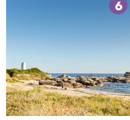
LA POINTE DE LA JUMENT

Bureaux d'Information Touristique Kerambourg - 29910 TRÉGUNC • 18 place de l'Eglise - 29920 NEVEZ + 33 (0)2 98 06 87 90 • info@destinationccpa.bzh • www.deconcarneauapontaven.com