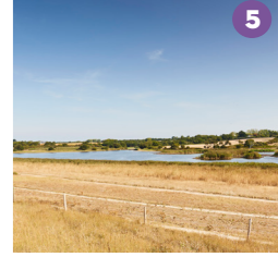
LES ÉTANGS DE TRÉVIGNON