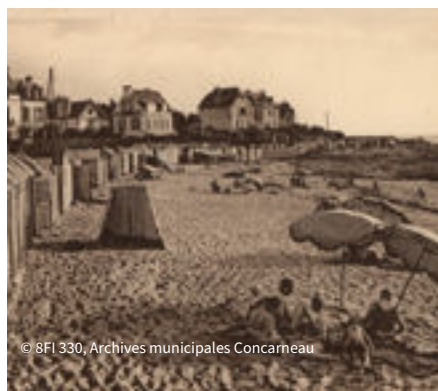
© 8FI 330, Archives municipales Concarneau

Êtes-vous prêts à embarquer pour la plus petite croisière du monde ? En famille, venez découvrir l'exposition De rives en rives, l'histoire capturée du bac du Passage . Vous pourrez ensuite construire la maquette du mythique bac Le Gouverneur, élément indissociable de l'histoire de la Ville.