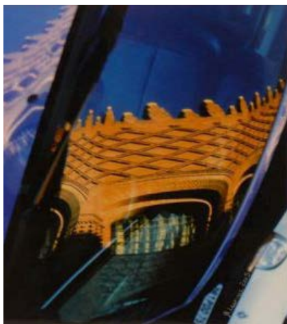
Sans titre 1, L. Petillon © Service Patrimoine

Le nom de Concarneau apparaît dans les textes au 13 e siècle. De ce siècle datent également les plus anciennes traces archéologiques de la Ville-Close. Mais qu'y avait-t-il avant ? Population de pêcheurs, moines ou seigneurs, vous découvrirez les traces parvenues jusqu'à nous pour comprendre le Concarneau du début du Moyen Âge.