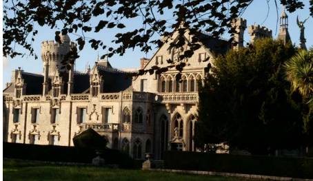
Le Château de Keriolet

Découvrez au cours de cette conférence le parcours de cet architecte prolifique et ses grandes réalisations à travers le Finistère.